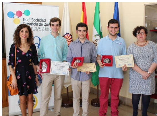
Ganadores Fase Local Córdoba XXXI Olimpiadas de Química