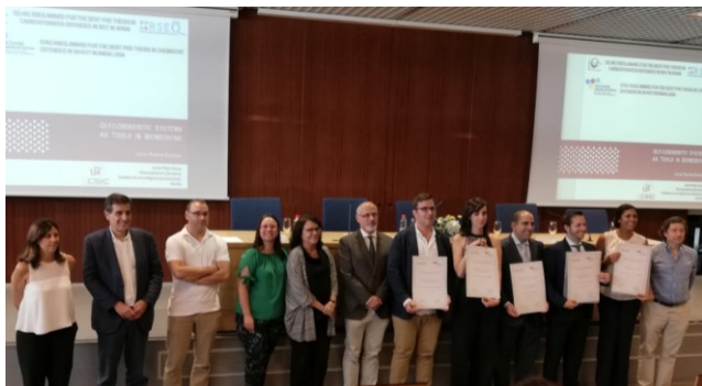
Acto de Entrega de Premios a las Mejores Tesis Doctorales 2016-2017.

Se incluyen algunas fotos de los actos realizados: