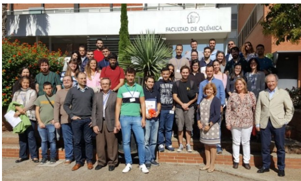
Participantes en el II Congreso de Estudiantes de Doctorado en Química. Universidad de Sevilla