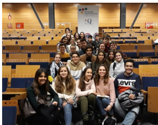
Participantes Fase Local Sevilla XXXI Olimpiadas de Química